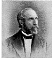
George F. Root, 即 aka G. Friedrich Wurzel (盧德 1820-1895)