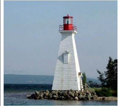
上圖乃加拿大東岸 Nova Scotia 省的 Kidston Island 燈塔

主的光如大燈塔；至於低燈好比我們見證的光照亮周遭。慕迪先生的意思是：許多人，被神的大光照亮，悔改信主，但不久又因四周沒有基督徒的好見證而跌倒。讓我們做一個在低處導人前行的小光，不要因我們的無光使他人淪亡。