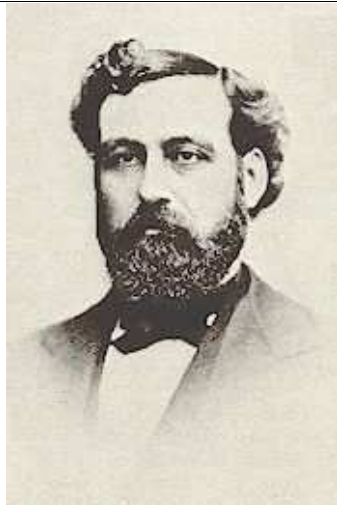
Philip Paul Bliss (腓力·布里斯) 簡歷：

這首詩的詞曲都是布里斯 (Philip P. Bliss) 所作，他是美國教會聖詩史上不可泯沒的功臣之一。他所作的福音詩歌，文字簡潔，音樂單純，韻律輕鬆，與當代及較古老的肅穆刻板的教會聖詩截然不同。