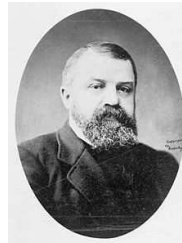
Dwight Lyman Moody (慕迪先生 1837-1899)