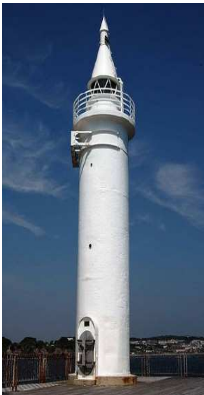
上圖乃東京 Syonanko Lighthouse

布里斯早期在聽道、聽見證、與人交談、遊覽古蹟時，靈感觸發作出美麗的詩歌。這首《你的光當照耀》是聽慕迪先生講道所說的一個故事：