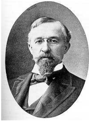
斯底平 (George C. Stebbins, 1846-1945)

斯底平 (George C. Stebbins, 1846-1945)，乃美國福音聖詩作家，在近代福音詩歌中佔有重要一席。他出身於農村。13歲時矢志專業音樂，在紐約水牛城(Buffalo)及羅徹斯特(Rochester)，修讀音樂。22歲遷居芝加哥，在Lyon and Healy音樂公司工作。曾在麻州波士頓浸信教會任音樂主任。及後於芝加哥第一浸信會任聖樂主任，在那裡認識慕迪佈道同工桑基(Ira D. Sankey, 1840-1908)。後應慕迪先生(Moody, 1837-1899)邀請，成為該佈道團的全時間同工，歷時25年之久。