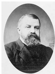
Dwight Lyman Moody (慕迪先生 1837-1899)