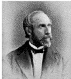
George F. Root, 即 aka G. Friedrich Wurzel (盧德 1820-1895)