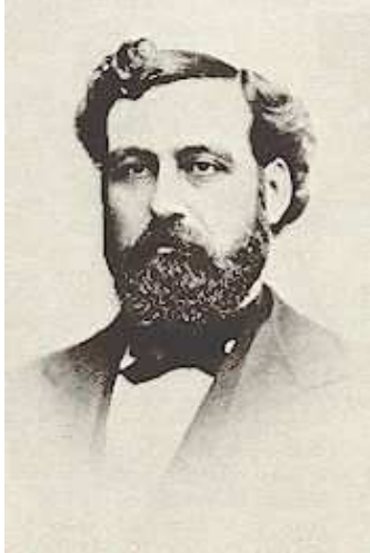
Philip Paul Bliss (腓力·布里斯) 簡歷：

這首詩的詞曲都是布里斯 (Philip P. Bliss) 所作，他是美國教會聖詩史上不可泯沒的功臣之一。其所作的福音詩歌，文字簡潔，音樂單純，韻律輕鬆，與當代及較古老的肅穆刻板的教會聖詩截然不同。